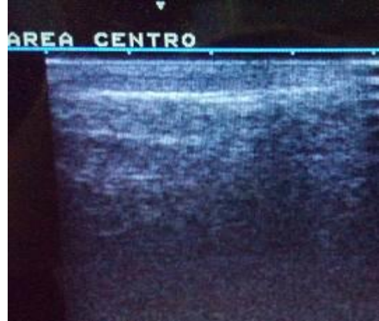
(Figura 4) Figura 4 Pabellón auricular sin lesión luego del tratamiento con HeberFERON)